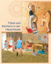
Toben und Klettern in der Heuscheune