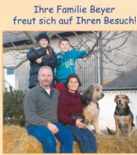
Ihre Familie Beyer freut sich auf Ihren Besuch!