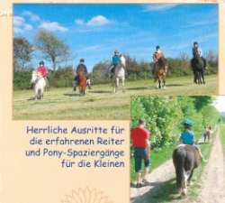
Herrliche Ausritte für die erfahrenen Reiter und Pony-Spaziergänge für die Kleinen